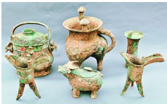
陕西周原遗址墓葬中出土的青铜器 资料图片