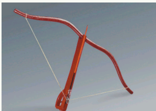
弓弩的复制品

记者昨日(2月26日)从秦始皇帝陵博物院获悉,秦俑一号坑第三次发掘首次发现完整的弓弩,弓弦清晰可见,考古人员推测材质可能是动物的筋。