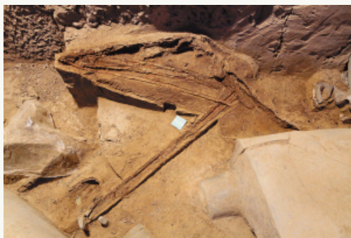
一号坑弓弩