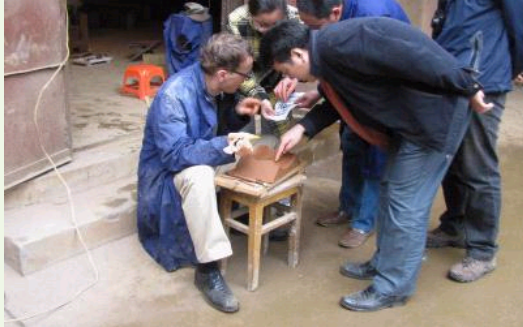
在陶范上制作纹饰