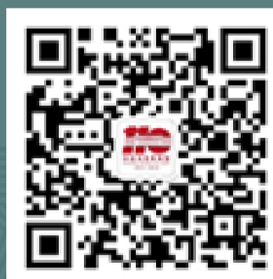
国家博物馆 微信服务号