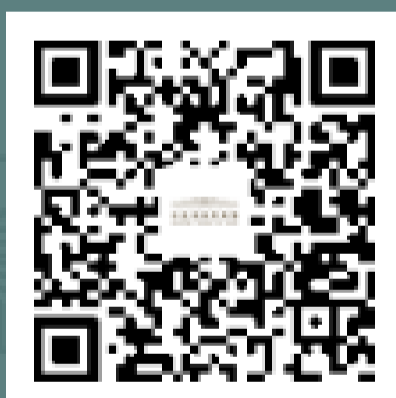
国博君 微信订阅号