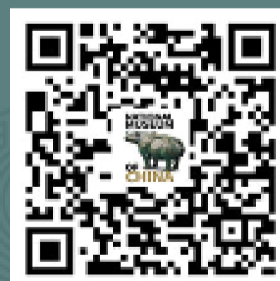
国家博物馆英文版 微信服务号