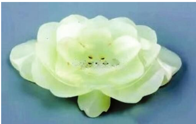
清代墓出土白玉头花。