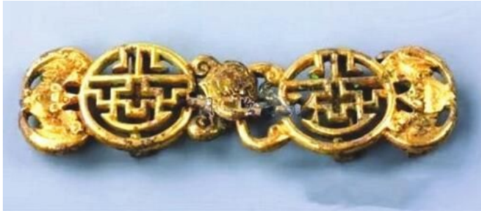
清代墓出土鎏金铜带扣