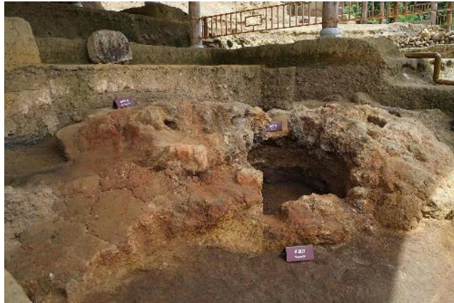
青阳下草埔冶铁遗址

“泉州：宋元中国的世界海洋商贸中心”申遗成功再次实证了古代中国与世界各国文明交流互鉴的辉煌历史和传统信念，向国际社会展现了中华民族开阔的视野、博大的胸襟，卓越智慧和自强不息、勇于开拓的精神追求，对于坚定文化自信、促进社会文化发展具有重要意义。