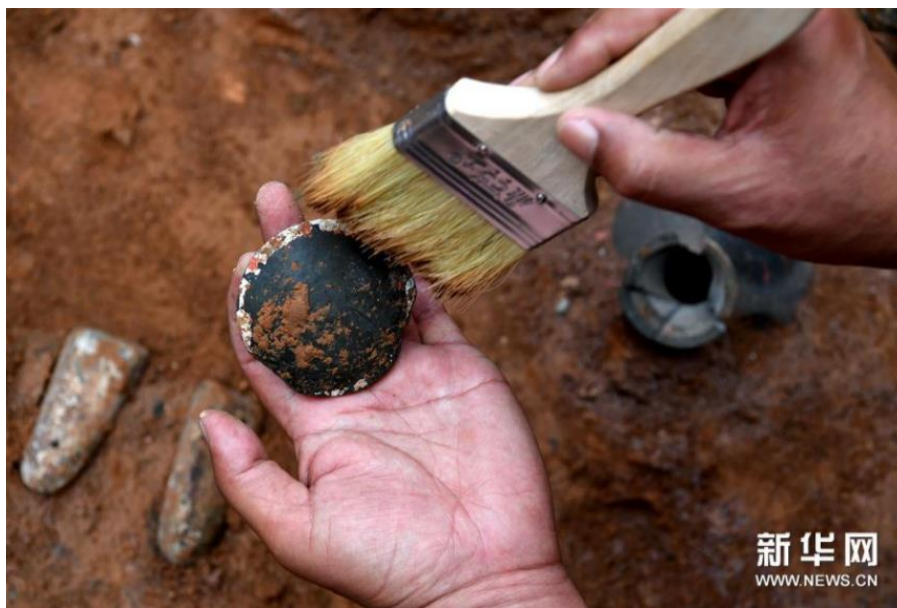
考古人员在清理河南洛阳一处西汉家族墓内的陶器（5月25日摄）。

据介绍，距离此处西汉家族墓不到两公里的范围内，曾发现一座较高等级的西汉大墓，因出土一件装有约7斤液体的青铜壶，液体被证实为矾石水，即古人眼中的“升仙药”，备受世人关注。