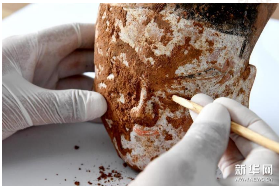
考古人员在清理河南洛阳一工地内的古墓群出土的俑头（5月25日摄）。

在其中一座空心砖墓中，画像砖上刻画有彩绘骑马狩猎图。或试图牵引骏马纵横驰骋，或单膝跪地弯弓直指猛兽，图中人物形象栩栩如生，飞鸟、仙树等元素成为西汉升仙思想的真实写照。