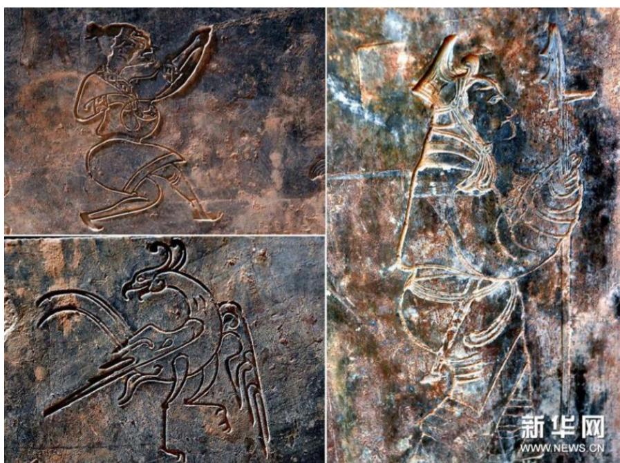
河南洛阳一处西汉家族墓中的空心砖墓画像砖上的图案 (拼版照片, 5月25日摄)。

为配合项目建设, 经国家文物局批准, 考古人员今年4月以来对河南洛阳一工地内的古墓群进行发掘。在发掘现场了解到, 一处西汉家族墓内, 出土青铜器1组, 包括铜方壶、铜鼎、铜盘、铜甗等, 留下诸多谜团。