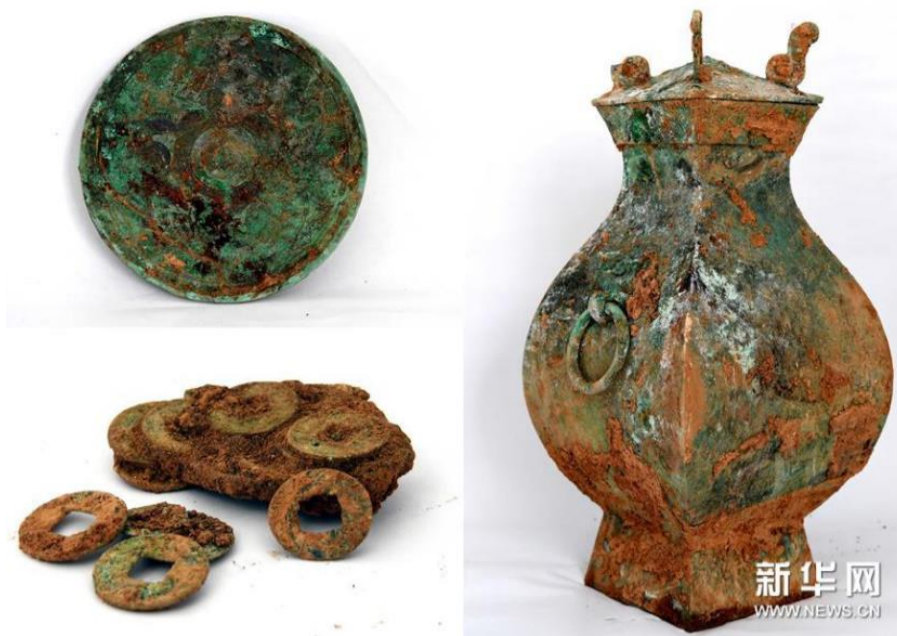
河南洛阳一工地内的古墓群出土的器物（拼版照片，5月25日摄）。

此处西汉家族墓由6座墓葬构成，呈L型分布，东西向4座，南北向2座。考古人员结合墓葬形制和已出土文物判断，墓主人可能为贵族及其家人。