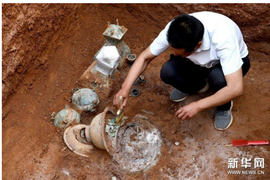
考古人员在清理河南洛阳一处西汉家族墓内的青铜器 (5月25日摄)。

半掩于土层之下, 1组青铜器刚被发现不久, 带着时光流转留下的斑驳。从铜方壶的壶口向内一窥究竟, 里面还存有半壶液体。