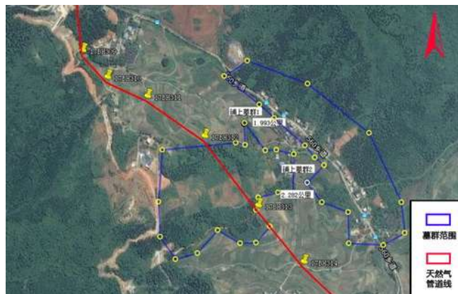
图二 铺上墓群与新粤浙天然气管道位置关系

2012年11月—2013年2月,湖南省文物考古研究所联合地市相关单位对中国石化新疆煤制天然气外输管道工程(新粤浙管道)湖南段项目进行了全面的考古调查和勘探工作,发现新粤浙天然气管道线在郴州市境内穿过文物点铺上墓群(图二)。