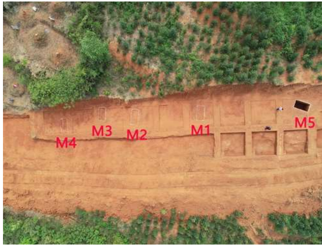
图三 铺上墓群M5分布位置图

墓葬位于石盖塘镇大溪村铺上组西南一低矮山岗（图三），编号为M5。M5为长方形竖穴土坑墓，口小底大，直壁略弧、平底，无枕木沟。墓口长230厘米，宽114厘米，墓底长248~250厘米，宽148~150厘米，残深226厘米。墓内填土为“五花土”，以红褐色黏土为主，夹杂较多黄色沙土和少量碳粒，质地疏松。通过二分法发掘，发现填土有夯层，夯层厚薄不一（图四）。由于埋葬在酸性较强的网纹红土中，棺槨、人骨均腐朽无存，埋葬方式、头向不明，墓葬方向165°。