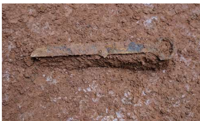
图八 M5出土环首铁刀

M5随葬鼎、盒、壶的陶器组合且陶盒有矮圈足，对比《广州汉墓》1的研究成果，初步推测该墓的年代为西汉中晚期。