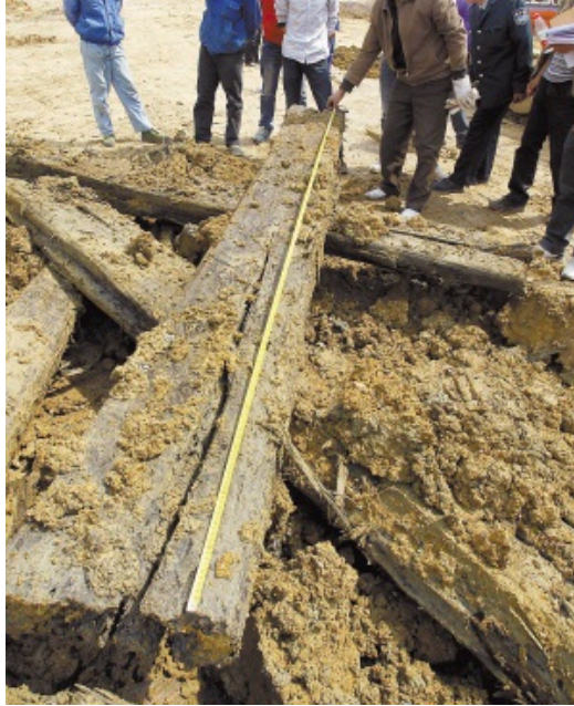
经测量，最长的椁板3.2米。

考古专家还介绍说，由于墓葬地下埋藏环境的原因，在徐州以往的考古发现中，汉代棺椁都已腐烂成泥土状，只能保留下红色的一层薄薄的漆皮。而这次发现的汉代木质棺椁未腐烂，并且被发现时是完整的，这在徐州是第一次遇到这种情况。棺椁木板没有腐烂的原因，可能和棺椁制作本身以及埋藏地点的土质都有关系。