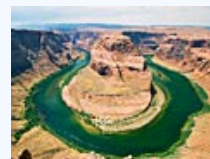
见识大自然的极致之美