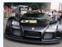
实拍德国顶级超跑