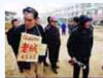
有一种暴力叫做示众!