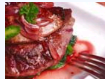
识别假冒伪劣食物