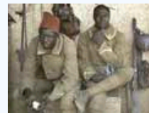
罕见的一战彩色老照片