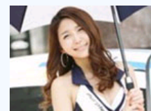
千娇百媚赛车宝贝