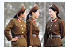
网友带你走近神秘朝鲜