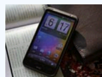
还能更坑爹吗?细数