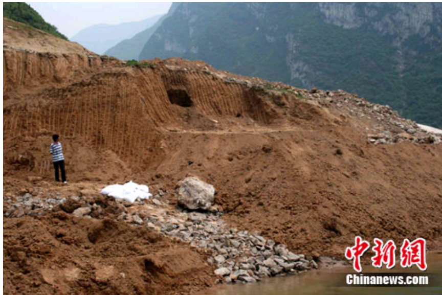
古墓位于三峡库区库岸岸坡

作者：郭晓莹 李迎迎 发布时间：2011-06-17 文章出处：中国新闻网 点击率：[936]