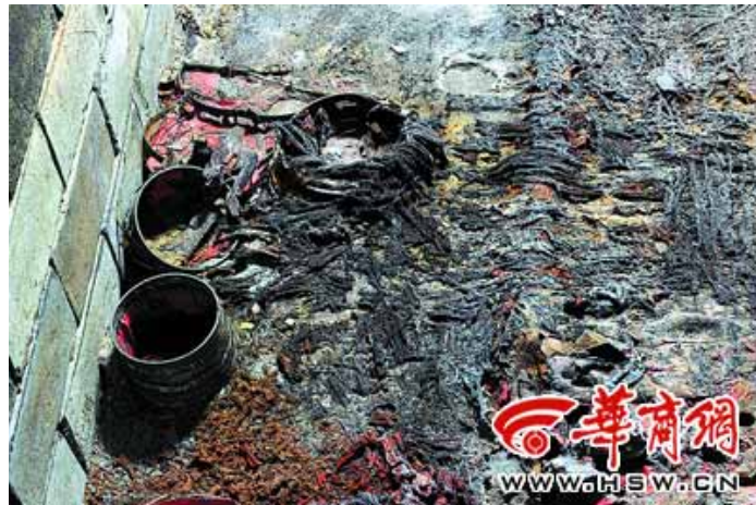
在墓室的左边发现有金银箍饰漆器

作者： 发布时间： 2011-05-27 文章出处： 华商网 点击率： [1160]