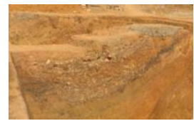
广西贵港考古大发现：旧城区挖出汉代护城壕