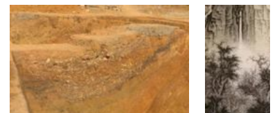
广西贵港考古大发现: 旧城区挖出汉 工笔山水的唐代护城壕