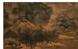
天津博物馆馆藏中国古代书画