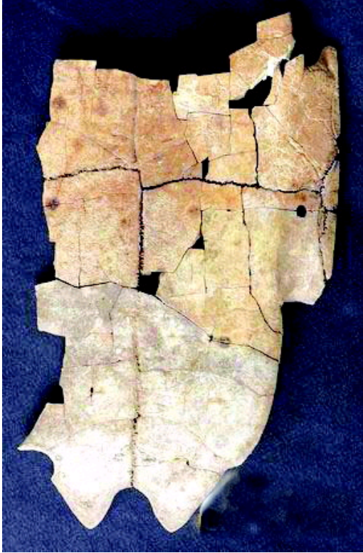
大辛庄商代遗址出土甲骨文

http://www.wenwuchina.com/news/ 2011-7-13 9:10:07 作者：刘江波 来源：大众日报