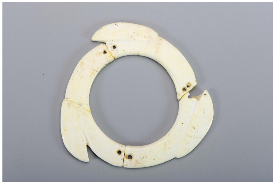
出土的玉璇玑