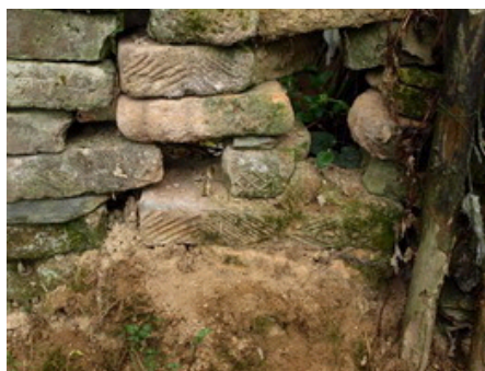
图三：江家村墓地上发现的花纹砖