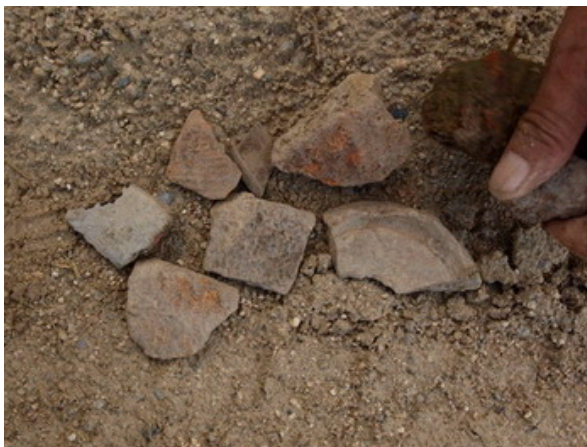
图一：仓塘湾遗址文化层中采集到一批商周时期陶片