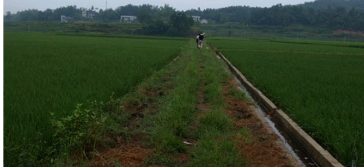
图二：鲢鱼嘴商代遗址，位于由鲢鱼嘴河冲积形成的平坦开阔谷地东部的山前台地上