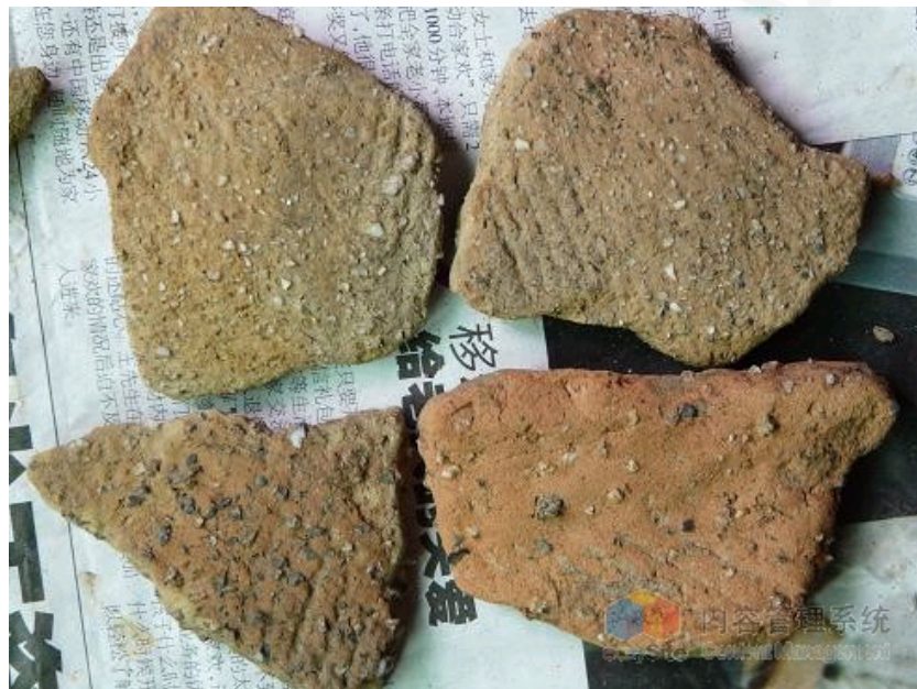
早期遗址出土标本

四川省广安市文物管理所结合第三次全国文物普查工作，于2009年2月与省考古研究院及各区市县联合开展了嘉陵江及渠江流域广安段文物考古调查工作。截止11月15日，野外调查全面结束，取得了丰硕成果。共发现新石器时期至元明时期文物82处（清以后除外），其中嘉陵江流域58处，渠江流域24处；遗址24处，墓葬37处，窑址15