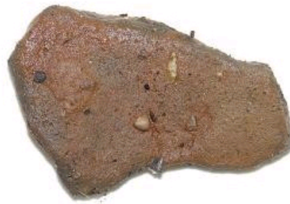
早期遗址出土标本

作者：四川广安市文物管理所 唐云梅 发布时间：2009-11-18 文章出处：国家文物局 点击率：[24]