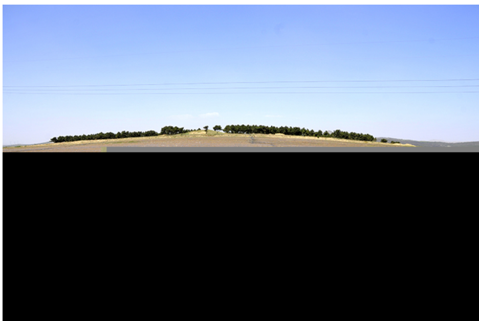
建平县三家乡扫虎沟东南遗址