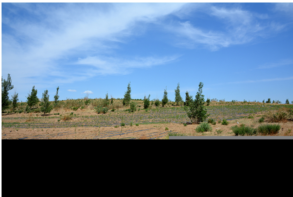
建平县哈拉道口镇门腰子梁顶遗址

4、2017-2018两个年度的调查获取了一批丰富的红山文化遗存，为进一步认识该地区红山文化遗存的内涵以及开展聚落考古学研究提供了材料基础。