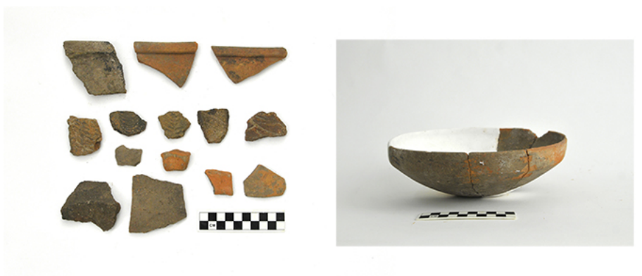
建平县奎德素镇谢家窝铺北坡遗址采集标本