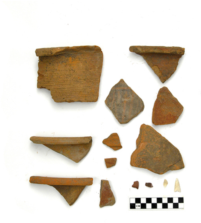
凌源市宋杖子镇后牛营子北山积石冢采集标本