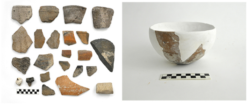
建平县哈拉道口镇门腰子梁顶遗址