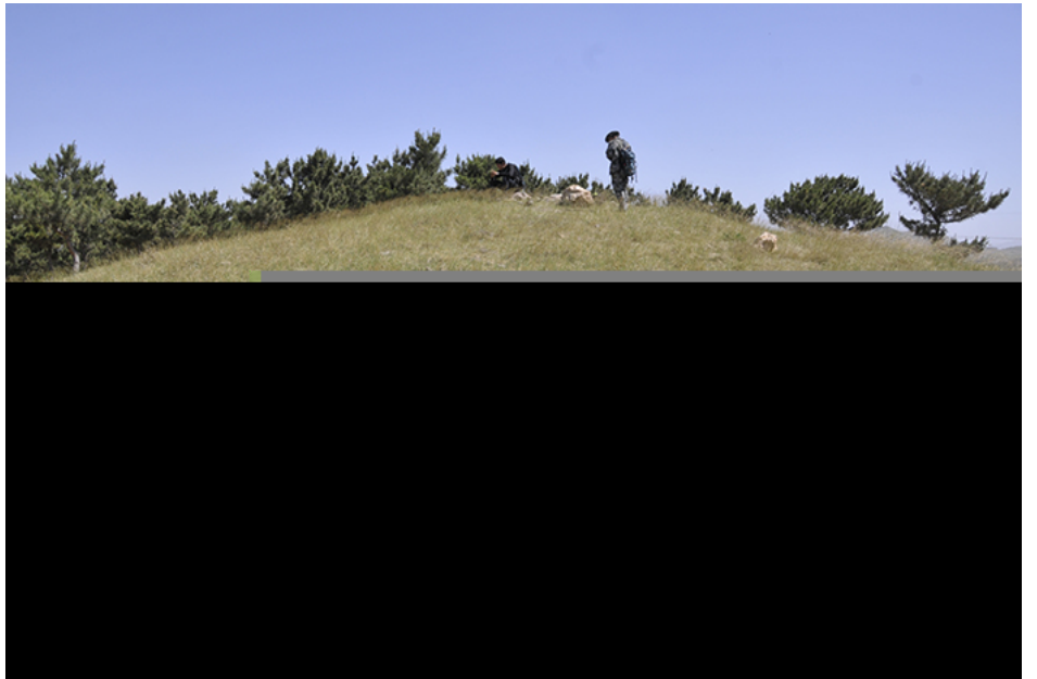
建平县三家乡扫虎沟东南积石冢