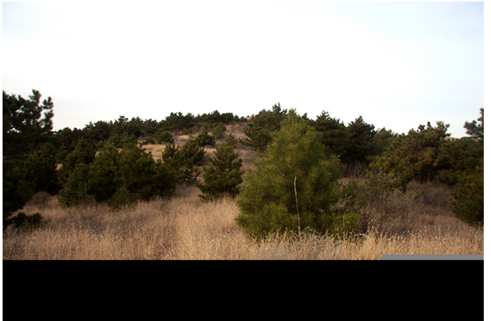
凌源市红山街道小北山积石冢