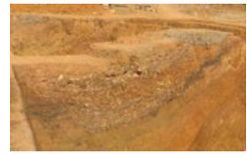
广西贵港考古大发现：旧城区挖出汉代护城壕