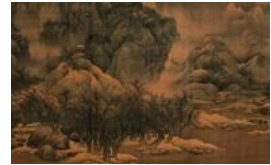
天津博物馆馆藏中国古代书画