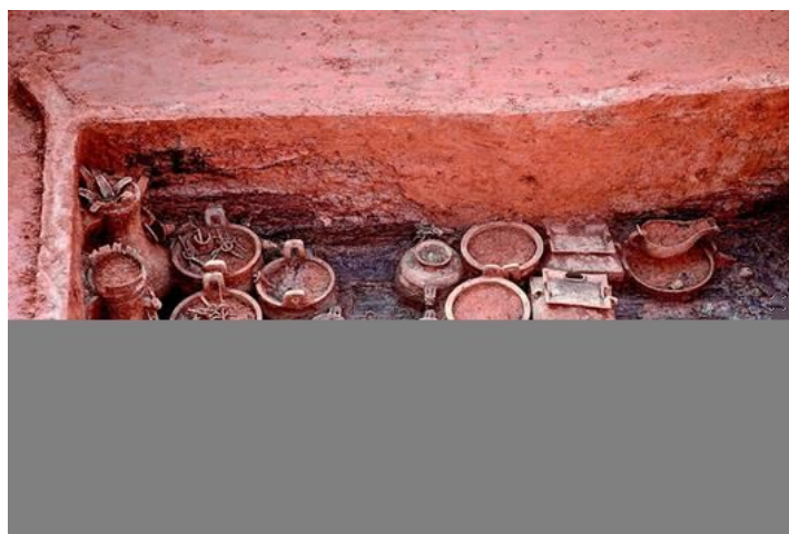
曾伯黍墓出土的青铜器物（局部）

1月16日，从“中国社会科学院考古学论坛”传来好消息，湖北京山县苏家垄周代遗址等6个考古项目入选“2017年中国考古新发现”。苏家垄遗址是一处包括墓地、建筑基址、冶炼作坊的曾国大型城邑。考古发掘了一批曾国高等级墓葬，其中一座