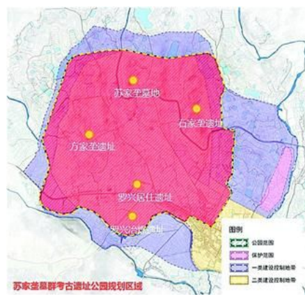
苏家垄遗址分布示意图

发布时间：2018-01-17 来源：湖北省文化厅 阅读次数：458 字体大小：