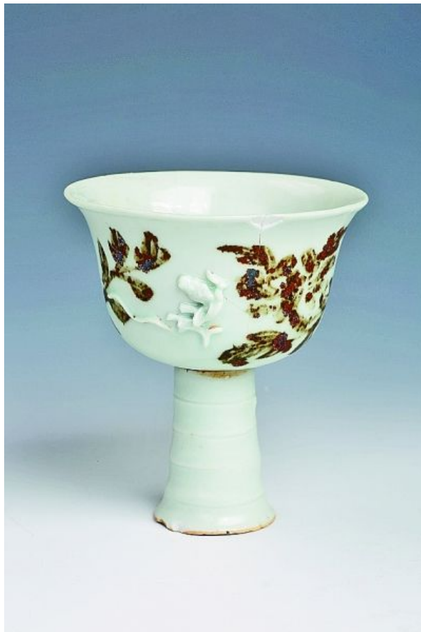
点褐彩堆塑螭龙纹转柄高足杯

根据考古发掘情况来看，遗址出土遗物主要为精美龙泉窑青瓷器、瓷片，总量达150余吨，是目前除龙泉窑址考古之外规模最大的一处龙泉窑青瓷遗存，在全国范围内都称得上独具特色，对补充元代龙泉窑青瓷标型器和建立元代龙泉窑青瓷标本库具有重要学术价值。同时，枢府瓷、元青花残片、青瓷（青白瓷）点褐彩器，是苏南地区瓷器标本的重大发现，弥足珍贵，填补了苏州地区文物馆藏的空白。