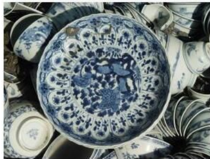
碗礁一号清代沉船出水青花瓷器