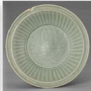
大练岛元代沉船出水青瓷盘

福建沿海地区发现的水下文化遗存大部分残存有船体残骸,出水遗物也十分丰富,尤以陶瓷器为主,窑口众多,反映了不同时期陶瓷器的海外贸易状况。出水陶瓷器中,以福建本地窑址、浙江龙泉窑、江西景德镇窑产品为主,此外还有部分浙江越窑、江苏宜兴窑以及其他地区窑址产