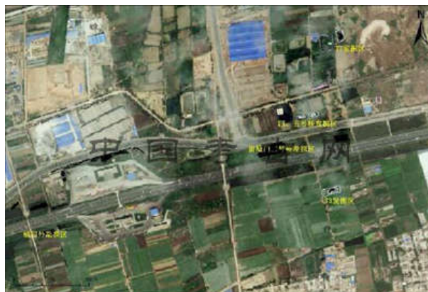
2015年渭桥遗址考古勘探、发掘位置图

汉长安城渭桥遗址位于汉长安城北城墙遗址以北的渭河故道。自2012年4月当地挖沙时发现古桥遗址后,陕西省考古研究院、中国社会科学院考古研究所、西安市文物保护考古研究院联合组成渭桥考古队开展工作。2015年在汉长安城横门外勘探面积约9000平方米,在古渭河河道内未发现渭桥遗存。在厨城门二号桥南向延伸线上勘探面积约4000平方米,发现个别立木和少量横木。在厨城门一号桥北端发掘,发掘出一艘汉代木船,为我国发现最早木板船,其用木榫板、木钉并联合船板的技术为国内首见,是罗马地中海区域广泛使用的造船技术,为长安—罗马“丝绸之路”文化交流新资料。在四号桥发掘中,发现一保存近乎完整的桥桩顶端榫卯,是3年渭桥发掘的首次发现。在五号桥卵石层下发现“大清道光年制”青花瓷片,进一步确定至迟在道光时期渭河主河道尚在发掘区一带。