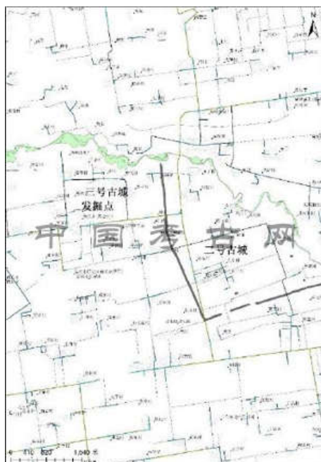
2015年度栎阳城遗址发掘探沟位置图

秦汉栎阳城是2001年国务院公布的第五批全国重点文物保护单位。从2013年开始,阿房宫与上林苑考古队重启秦汉栎阳城考古。在2013—2014年度考古勘探的基础上,2015年重点开展栎阳城三号古城勘探、栎阳城二号古城路网、栎阳城北大型沟渠勘探。在石川河西侧勘探发现东西向两条大型沟渠,应于郑国渠、白渠有较大关系。在二号城内外勘探发现同时期路网。10月下旬至12月底,在三号古城内开展考古发掘,布面积214平方米。发掘确认夯土台基三个,出土陶器上发现“栎阳”字样。