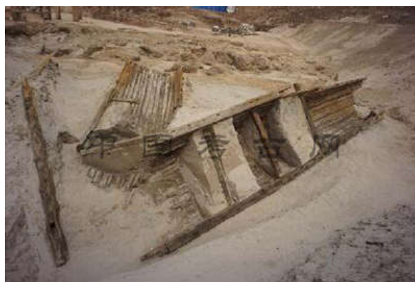
2015年渭桥遗址出土的“丝路一号”古船

栎阳、阿房宫、昆明池发掘单位:中国社会科学院考古研究所、西安市文物保护考古研究院 领队:刘瑞