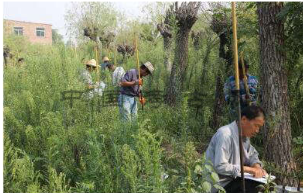
2015年斗门水库(昆明池遗址)考古勘探

昆明池位于西安西南今西安市长安区细柳街办与西咸新区沣东新城斗门街办一带。2013年以来,陕西省规划建设引汉济渭项目中“斗门水库”工程。2014年12月,受西安市文物局指派,西安市文物保护考古研究院代表阿房宫与上林苑考古队与西安昆明池投资开发有限公司签署斗门水库9.37平方公里考古勘探协议。后中国社会科学院考古研究所、西安市文物保护考古研究院组成阿房宫与上林苑考古队制订《陕西省斗门水库(昆明池遗址)考古工作实施方案》,从2015年7月开始至12月底,对斗门水库设计范围内地块开展考古勘探,勘探并确认昆明池进 口水口、进 水渠、池岸线、周围沟渠等遗存。