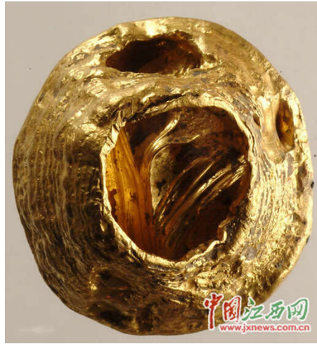
马蹄形金器（资料图）

专家一致认为南昌西汉海昏侯墓具有独一无二的价值，考古发掘具有先进的理念、科学的方法，取得丰硕成果，属于重大发现，价值十分重大。