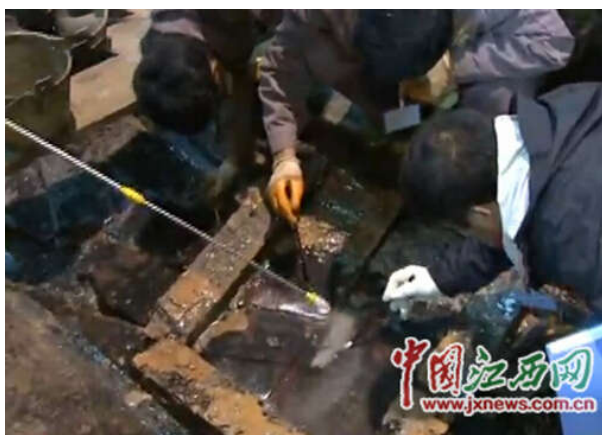
一扇记载孔子生平的屏风出土