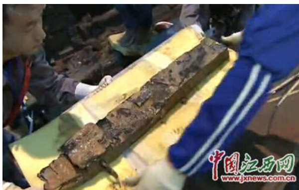
屏风将被打包运入实验室

由于漆器不能长时间暴露在空气内，专家组准备在拍照后及时提取，将这扇屏风打包运入实验室。