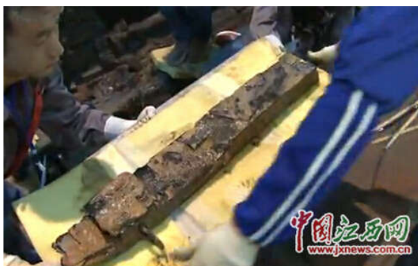
屏风将被打包运入实验室

由于漆器不能长时间暴露在空气内，专家组准备在拍照后及时提取，将这扇屏风打包运入实验室。