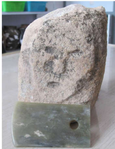
最新发现的“石雕人面像”和玉铲（9月8日摄）

主持石峁遗址考古发掘工作的陕西省考古研究院研究员孙周勇介绍说，在2011年至2015年的考古发掘中，石峁考古队在石峁外城东门的门址里发现过一些石雕头像的残块。而真正意义上的发现则是今年7月，考古人员在外城墙一处马面旁坍塌的筑石中意外发现一块完整的石雕人面像。