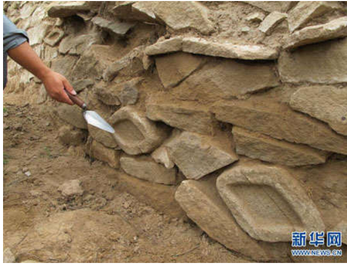
考古人员在石峁城址的核心区“皇城台”边坡上的墙体发现的放大版的一双眼睛（9月8日摄）

记者在“皇城台”的一道护坡石墙上看到，三块菱形的石头大小基本一样，都是通过浮雕眼眶来表现眼睛。从布局上看，两只眼睛的中间只隔一块石头，构成一个“别样的”石雕人面像；第三只眼睛则因其对称地方被破坏，永远失去了组成一双眼睛的可能，但仍然犹如“神的眼睛”般守护着古城。