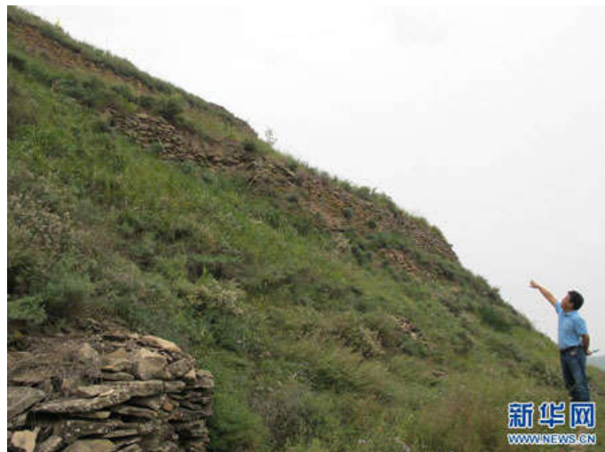
考古人员介绍石峁城址的核心区“皇城台”边坡上的高大墙体（9月8日摄）

“此前民间收藏的二十多件石雕人面像，据传都是发现于石峁遗址核心区——‘皇城台’。为此，我们近年来对其进行了详细调查，虽然没有发现类似的石雕人面像，但今年却幸运地发现了石墙上装饰着‘另类’的石雕人面像，即用雕刻出的一双眼睛来象征人面的存在。”孙周勇说。