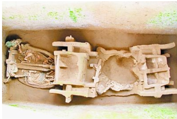
图为车马坑K1。资料照片

发布时间: 2015-01-21 文章出处: 光明网 作者: 杨永林 张哲浩 点击率: 1218