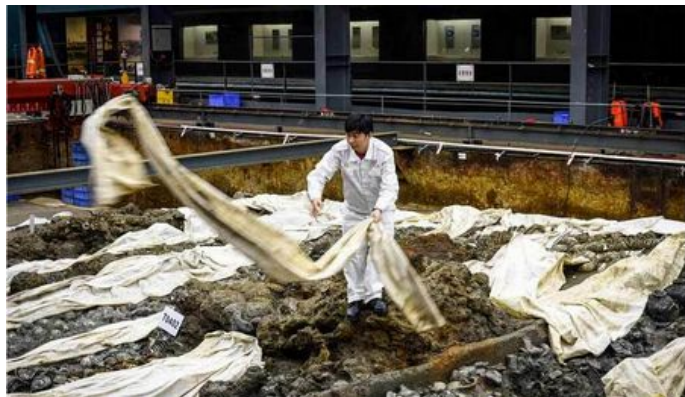
在广东阳江“南海一号”博物馆，一位考古工作者向沉船船体木质结构部分覆盖浸泡过特制药水的白布加以保护。从考古学角度来看，对沉船船体的研究意义甚至大于船上的这些南宋瓷器。