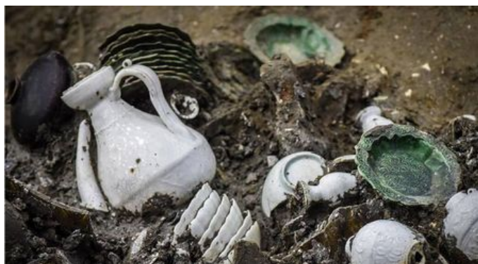
“南海一号”右侧中部船舱位置散落着一摞福建德化窑白瓷器和福建磁灶窑绿釉器（1月28日摄）。