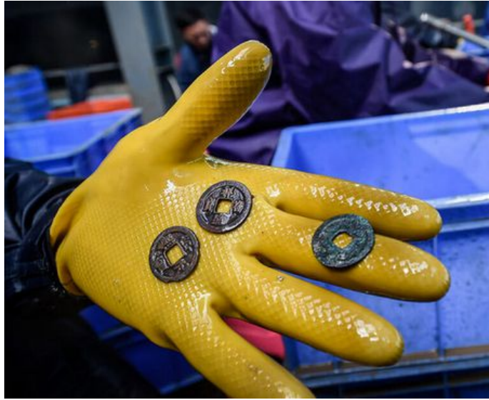
这是考古工作者对“南海一号”上清理出来的淤泥海沙等凝结物进行水洗时发现的三枚古钱（1月28日摄）。