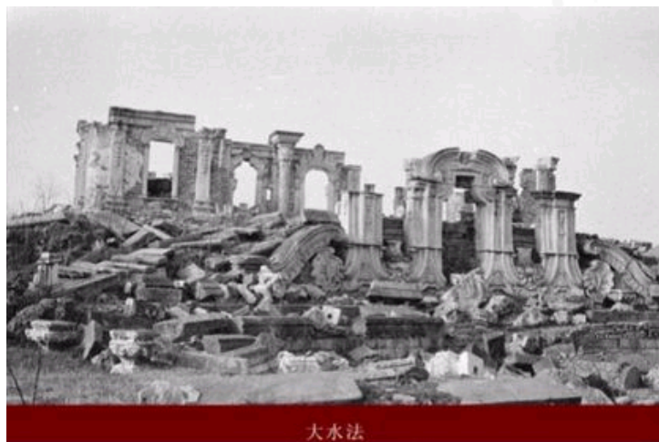
浩劫后的大水法遗迹早期照片

众所周知，1860年10月，圆明园遭到英法联军的洗劫和焚烧，此事件成为中国近代史上让国人永难忘的一页屈辱史！正因为这样特殊的历史背景，赋予了圆明园更多的历史价值和意义。它成为激发国民知耻后勇、奋发图强、不断向前的塔标。