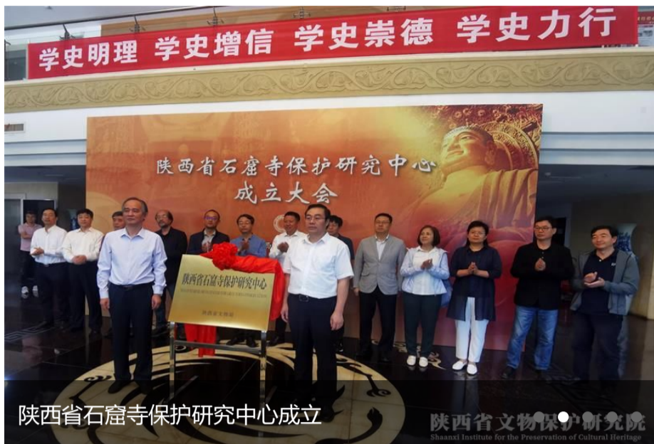
陕西省石窟寺保护研究中心成立