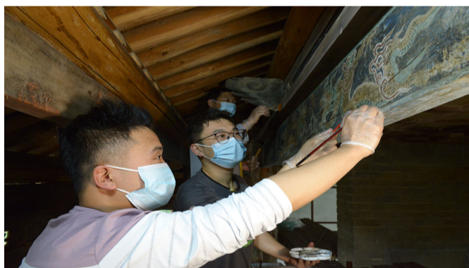
文保院完成紫阳北五省会馆古建筑彩画保护修复现场...