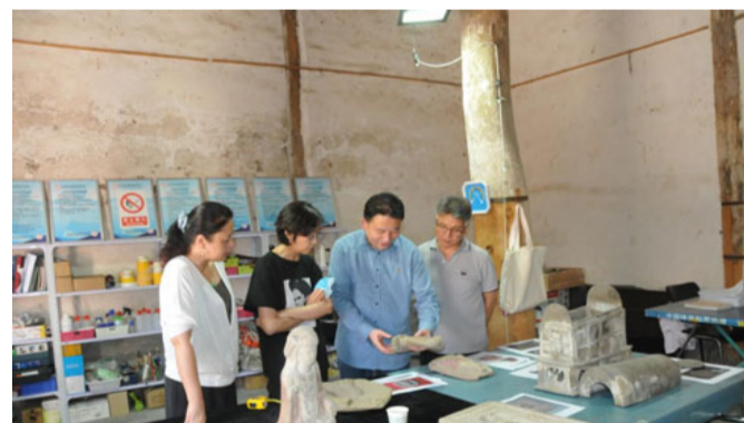
文保院完成甘肃省泾川彩绘石造像保护修复项目现场...