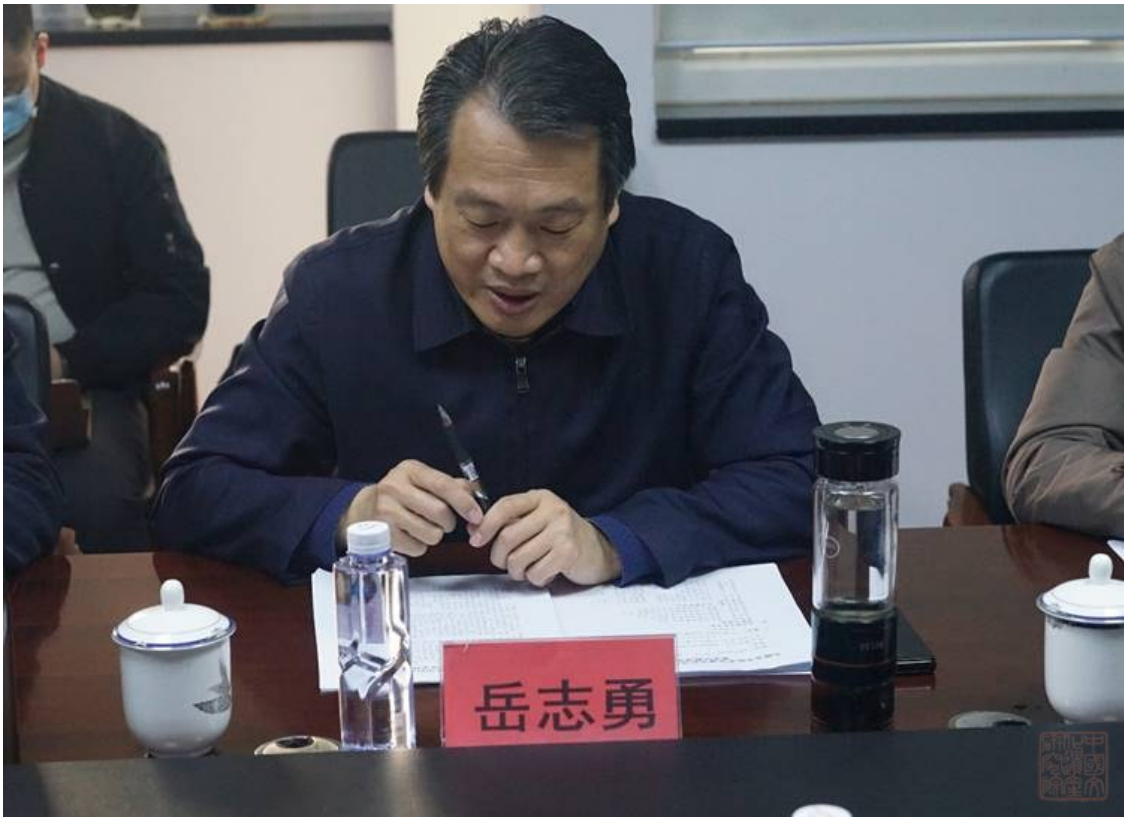
国家文物局督查司岳志勇副司长主持会议