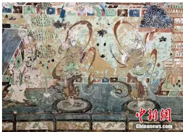
资料图：敦煌唐代壁画。

莫高窟的壁画和彩塑被数字化“搬”出洞窟，完成玉门关、汉长城、悬泉置遗址监测预警体系工程，境内长城及烽燧完成抢险加固，修复西云观壁画病害，为每个文物保护单位“树碑立界”……近年来，敦煌加速文化遗产保护，全力破解文物保护与合理利用的难题。