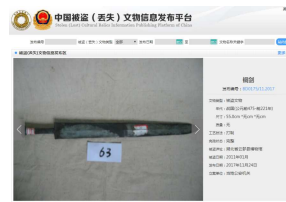
我国将发布“外国被盗文物数据库”