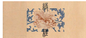
如果爱，请如《诗经》般热烈地爱