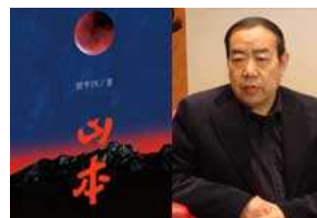
贾平凹：《山本》是我的秦岭之志

人民网版权所有，未经授权禁止使用 Copyright © 1997-2018 by www.people.com.cn. all rights reserved