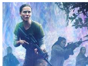
揭秘《湮灭》到底好在哪儿