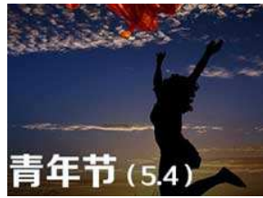
致青春：愿你以梦为马，不负芳华