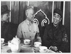
1966年刘少奇与周恩来