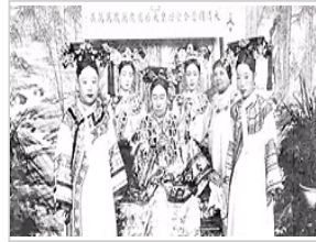
德龄眼中的慈禧：不全