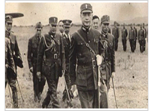
罕见历史记录：汉奸汪