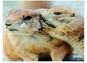
摄影师拍超萌土拨鼠“亲”