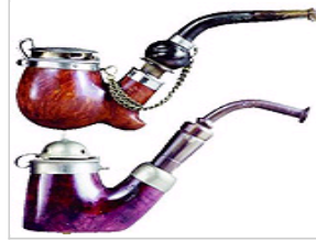
限量版烟斗成收藏黑马