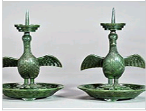
武汉博物馆“晒”藏玉