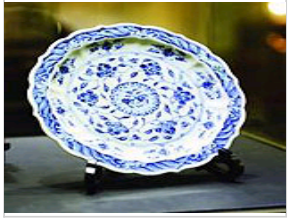
明朝青花瓷真容曝光