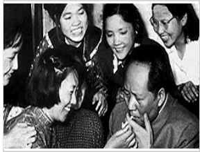
毛泽东戒烟：久戒不成