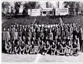
“文革”举行足球赛合照