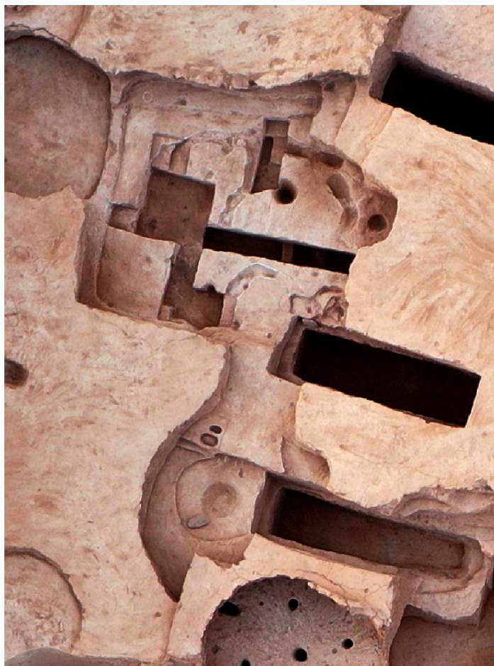
赵窑遗址五号房址航拍照。

考古人员发掘发现,五号房址是一座半地穴双室房址,前室居北,后室居南。在前室东壁北部、门道台阶南侧有一半圆形壁炉,壁炉直径0.8米。