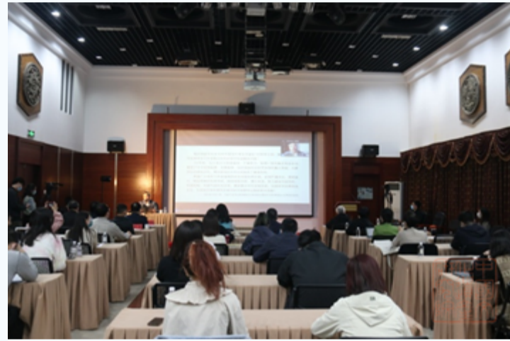
国家文物局原副局长宋新潮授课现场

本期培训是我院第15次承办考古发掘项目负责人岗前培训班，面向84名2021年度新任的考古发掘项目负责人开展线上教学，时长6天。来自国家文物局、中国社会科学院、北京大学等13位专家学者就考古政策与管理、田野考古工作规程、城市考古、科技考古、数字考古、考古现场文物保护技术和材料等内容进行授课。课程期间邀请国家文物局考古司考古管理处张凌处长与十名学员代表围绕考古发掘工作经验、国内考古相关法律法规、十四五期间重点研究方向等展开线上研讨交流。全部学员提交84篇培训总结、10篇研讨纪要，达到考核要求，84名学员获得国家文物局结业证书，顺利结业。