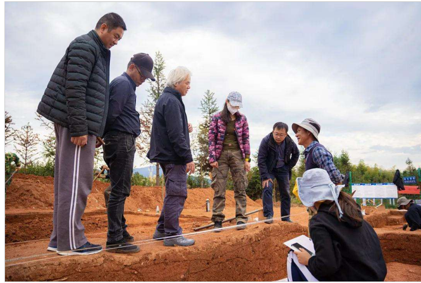
(来源: 马道坪遗址田野实习考古队 文: 康伊帆 图: 郭宸)