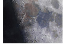
数千张照片合成超高清