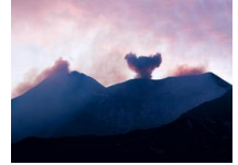
火山灰酷似鲸鱼尾巴