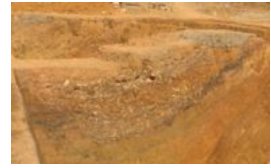
广西贵港考古大发现：旧城区挖出汉代护城壕