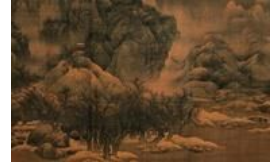
天津博物馆馆藏中国古代书画