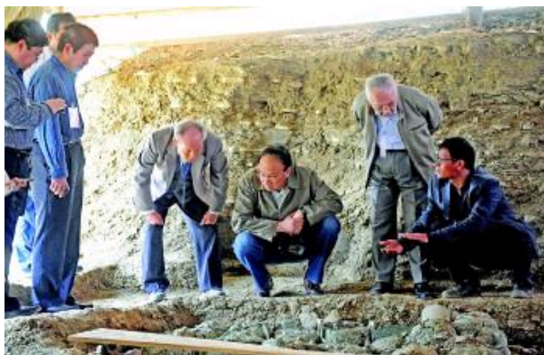
考古专家在研究南边箱青铜礼器。

根据考古常识,墓葬等的断代应该参照出现最晚的器物。因此,这处墓葬的建成时间最早不会早于春秋晚期或者“春战之际”。