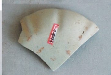
北宋末期地层出土