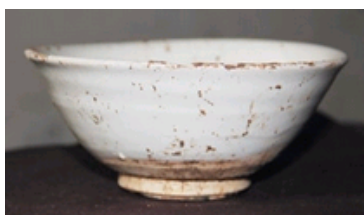
金元时期地层出土白釉碗

为了进一步完善和建立对钧窑不同时期产品特点的认识及其发展序列,特别是了解明代初年钧窑的生产面貌,并探讨钧窑民窑生产和官窑生产的关系,北京大学考古文博学院、河南省文物考古研究所组成联合考古队,于2011年9-12月对河南省禹州市鸠山镇闵庄钧窑遗址进行了主动考古发掘。为了进行分期研究和完善钧窑的发展序列,我们在闵庄村内的四个地点布方发掘,以期获得不同时期窑业生产的资料,特别是探讨元明时期钧窑的基本面貌,以及钧瓷民窑生产的特点。发掘共开探沟、探方17个,发掘面积565平方米,文化层一般厚2-3米,最深的地层深达7米余;清理了各类遗迹26处,其中窑炉6座、作坊2座、灰坑12个、灶3座、井2个、墙2道,出土了大量瓷器和窑具,其中完整或可复原标本数千件。取得了较重要的成果。