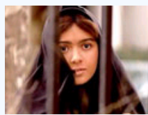
伊朗处女处处死刑需破身