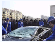
砸毁兰博基尼实拍