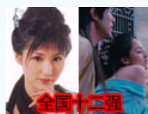
肉蒲团蓝燕是黛玉候选