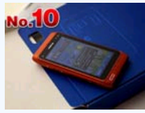
全球10大智能手机排行