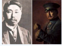
辛亥革命演员原型对比