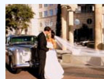
全球各地另类婚车图集