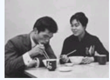
美拍59年日本年轻人