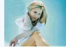
教你怎样保护大脑