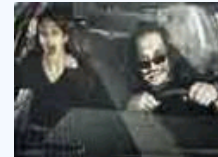
风挡玻璃后面的那些事