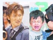
柏芝哭诉欲抱子跳楼