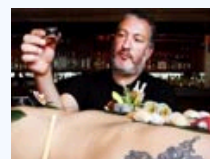
全球盛大裸体艺术