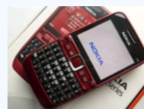
山寨机不能比 白菜价