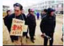
有一种暴力叫做示众！