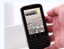
2款国产强机入围 最易