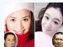
曝明星美貌千金私照