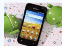
价格不降反升？近期最