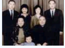
移居加拿大的张国焘