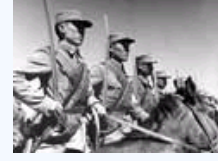
盛世才治理下的新疆