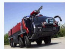
全球最酷的清洁车