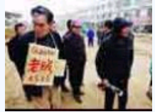
有一种暴力叫做示众！