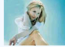
教你怎样保护大脑