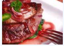
识别假冒伪劣食物