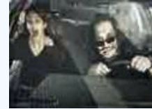
风挡玻璃后面的那些事