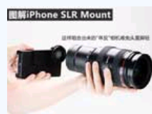
让乔布斯泪流满面！图