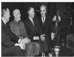
蒋介石迁台最大原因: