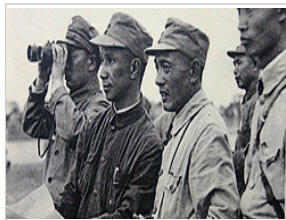
毛泽东五虎将歼敌数比