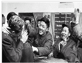
56年前老照片尺度大: