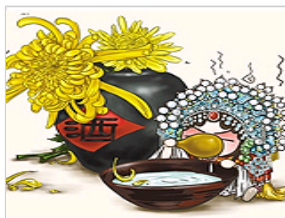
“舌尖上的京剧”漫画走