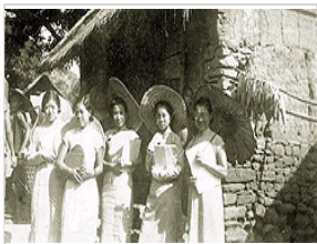
民国废旧历致学校春节