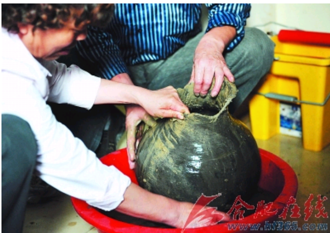
工作人员正在清洗出土的陶壶

没有玉璧，便用滑石代替玉石，雕刻一块心爱的璧生死相随。9月23日，合肥市文物管理处对肥西乱墩子工地所发现的一处西汉墓进行发掘清理，发现墓主人极其推崇那个年代流行的物件璧，虽然经济条件所限不能拥有一块玉璧，但仍然用滑石雕刻一块与玉璧纹饰一模一样的璧器。