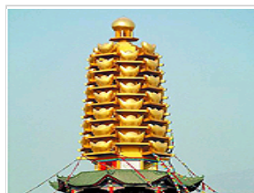
河北元宝塔入选十大最