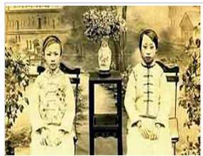
揭秘清朝末皇族格格长相