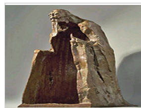
“2012卢浮宫国际美术展