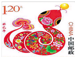
蛇年生肖邮票被赞很“萌”