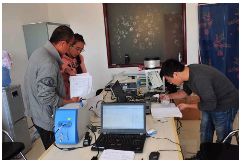
石峁遗址临时库房现场无损分析