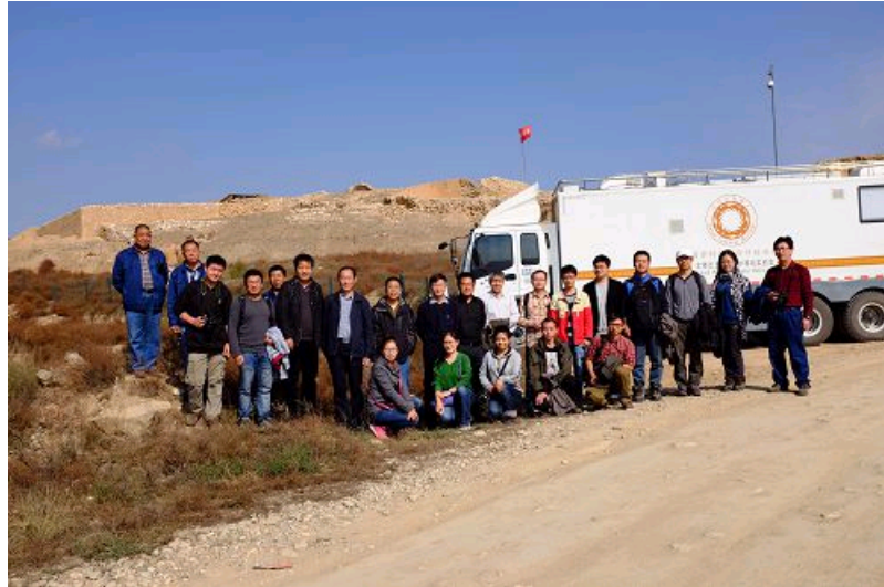
文物出土现场保护实验室及课题组成员在石峁古城遗址