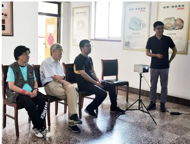
专家听取发掘汇报

对于发掘中揭露的夯土台基，刘庆柱先生认为属于典型的秦汉时期高台建筑，形制与秦咸阳一号宫殿等有相似之处，发掘中可多参考秦咸阳城、栎阳城、阿房宫及汉长安城等考古项目资料，但也要注意遗迹、遗物的地方特色。遗址具体年代可采用热释光等测年技术来得出，以秦始皇、汉武帝东巡的关键时间点为线索，确定遗址的准确分期。琅琊台遗址位于山东沿海，反映出秦汉大一统王朝对于海洋的重视以及早期领海概念的形成，代表我国历史上海洋意识崛起的先声，考古资料的研究解读，对我国目前海洋强国战略有重要现实意义。