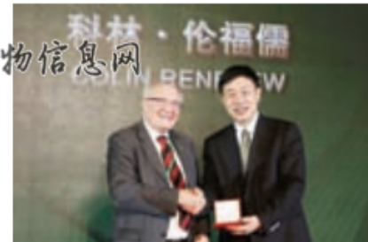
伦福儒教授获终身成就奖