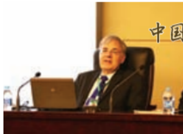
公众考古论坛罗泰教授演讲