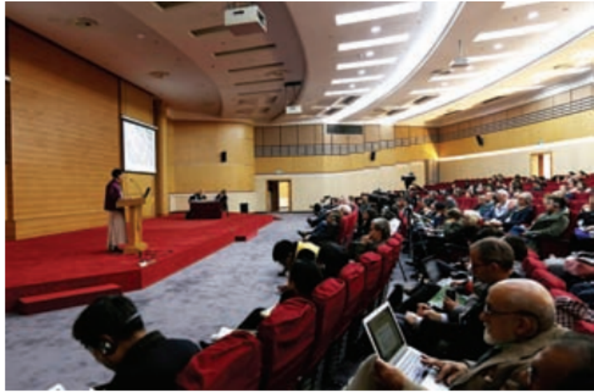
大会现场 中国文物信息网