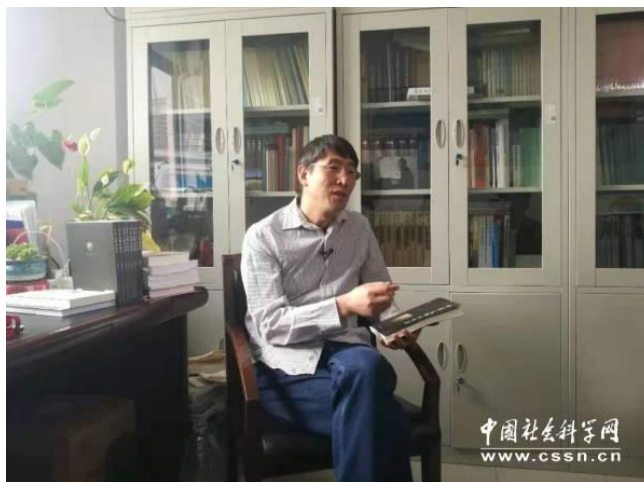
中国人民大学历史学院韩建业教授接受中国社会科学网采访

韩建业，中国人民大学历史学院教授，教育部“长江学者奖励计划”特聘教授，主要从事新石器时代考古和中华文明起源研究。近日，韩建业教授的新作《中华文明的起源》由中国社会科学出版社正式出版，新作收录作者关于中华文明起源方面的研究论文和普及性文章共28篇，从多个方面论述了中华文明起源、形成和早期发展的过程，认为中华文明起源于8000多年以前，形成于5000多年以前，至少存在北方、东方、中原三种起源模式，环境演变和战争冲突在文明演进过程中起到重要作用，多要素、多路径的综合作用最终塑造了中华文明独特的文化基因和绵长的历史记忆。