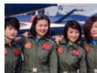
歼击机女飞行员首