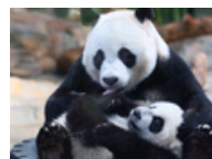
熊猫三胞胎成长史