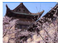
盘点国内最美学府